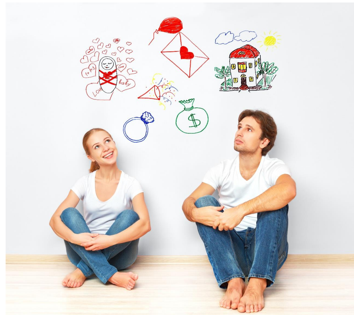
Proyecto de Vida